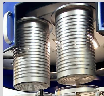
Koszyki w sekwencji wirowania (P400)