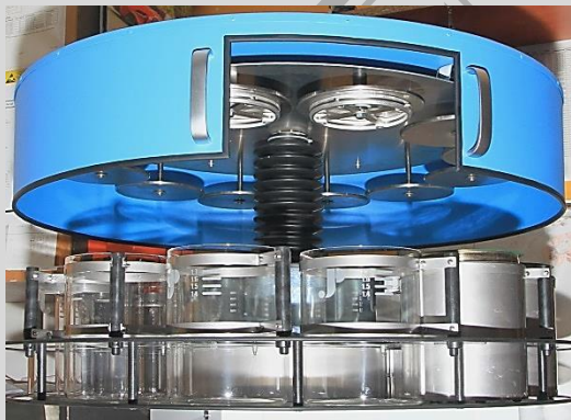
Obszar roboczy aparatu (P240)