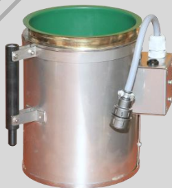
Stacja parafinująca (P240)